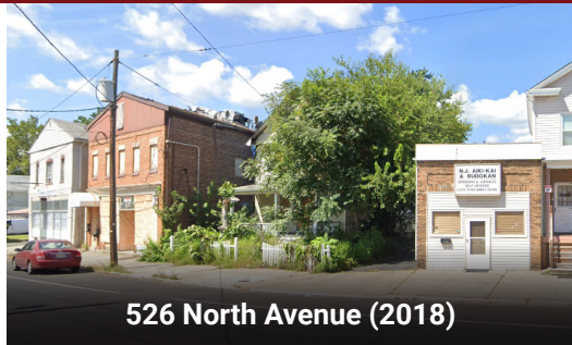
526 North Avenue (2018)