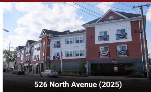
526 North Avenue (2025)