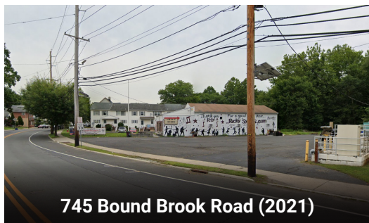
745 Bound Brook Road (2021)