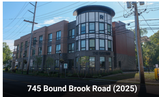
745 Bound Brook Road (2025)